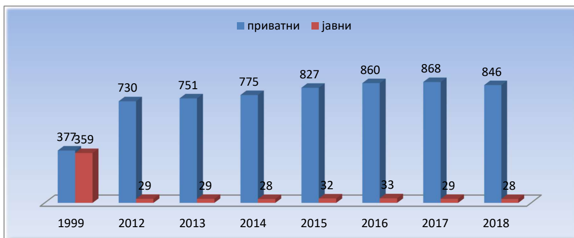
Дијаграм 2. Јавни и приватни стоматолошки здравствени установи во Р. С. Македонија 1999, 2012 – 2018